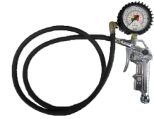
Inflating gun (only for base version)