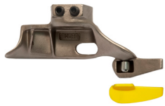
Front head protection